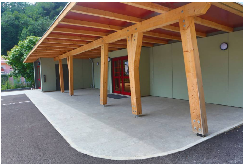
LOCATION SALLE COMMUNALE

Pour toutes informations concernant une location, merci de contacter le 06 60 93 49 19.